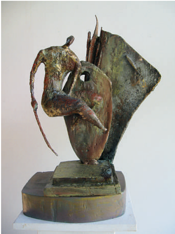
Balance I Bronze, 50 x 24 cm, 2021

Autobahn Garmisch A95, Ausfahrt Schäftlarn-Neufahrn ab Ausfahrt ca. 700 m oder B11 über Hohenschäftlarn nach Neufahrn