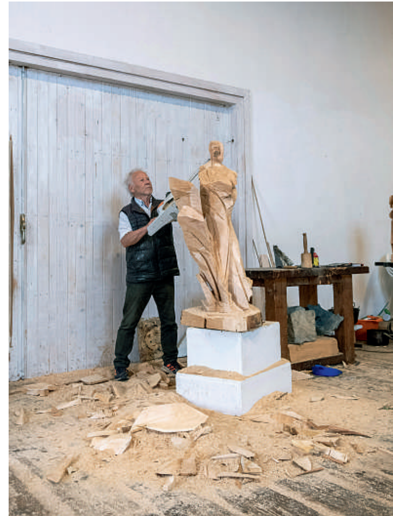
...im Prozess 2021